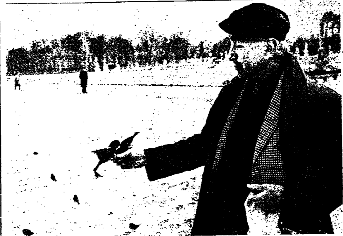
ملك الهواء يرتجف

حديثي هذا عن قصة - اوبلاص اسطورة - اسطورة صينية عتيقة كيوطنها الصين التي كانت تسمى « اسطورة السماء» قبل ان تصبح جمهورية شعبية اشتراكية . وكجميع الاساطير الشرقية تنهلنا في اسطورتنا هذه القصة الشعبية وخصب الخيال والغمزى العميق الذي لا يعد عن الحكمة التي اشتهرت بها بلاد بنت سوراً هائلا يمتد على طول حدودها الجنوبية من الغزاة القاتنين ثم ليصبح ، بعد قرون وقرون ، احد اعاجيب العالم السابع . اسطورتنا تدور حول الفيرة . ان من تلاميذ عاتقته - او غريزة - انسانية خلقت مع الانسان يوم خلق ، ويستعيش معه ادم حيا يرزق لا فرق بين عرق ابيض او اسود او اسود اولحمر او ام لم يكن عظيم ، بطل شكسبير الشهير ، ورمز الفيرة الحجرية ، اسود البشره ؟ اسطورة الصينيه تدور حول الفيرة . ان من تلاميذ عاتقته - او غريزة - انسانية خلقت مع الانسان يوم خلق ، ويستعيش معه ادم حيا يرزق لا فرق بين عرق ابيض او اسود او اسود اولحمر او ام لم يكن عظيم ، بطل شكسبير الشهير ، ورمز الفيرة الحجرية ، اسود البشره ؟